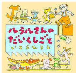
ルラルさんの だいくしごと