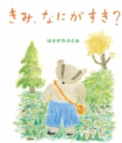
きみ、なにがすき? はせがわさとみ作