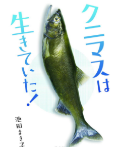
クニマスは 生きていた!