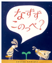
なずずこのっぺ? カーソン・エリス作