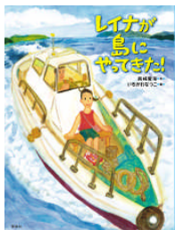
レイナが島に やってきました!