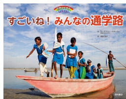
すごいね! みんなの通学路