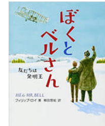
ぼくとベルさん フィリップ・ロイ作