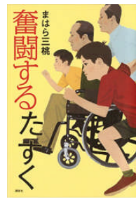
奮闘するたすく まはら三桃作