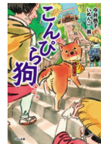
こんびら狗 今井恭子作