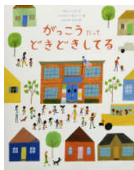
がっこうだっぺ どきどきしてる アダム・レックス作