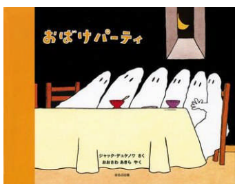
おぼけパーティー

今月末にはハロウィンがあります。それにちなんで今回は「おぼけ」をキーワードに4冊の本を紹介したいと思います。